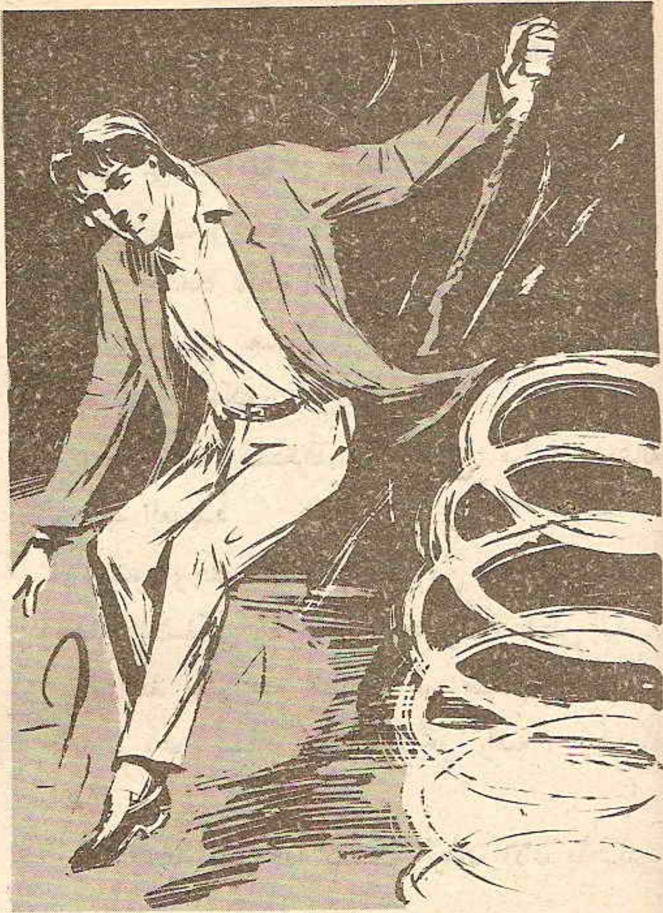
ثم وثب وثبة هائلة ، ليسقط على الأرض بعيداً عن الأطواق المشعّة ..

كانت السقطة قوية عيفة ، حتى أنه شعر بقدميه